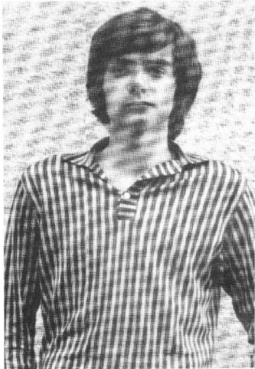
Období mládí a vzrůstu, každá doba má svoji délku vlasů