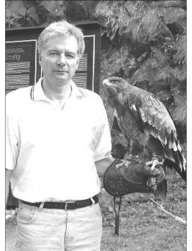
Chvilke odpočinku během prázdninového mítinkového turné ve východních Čechách.