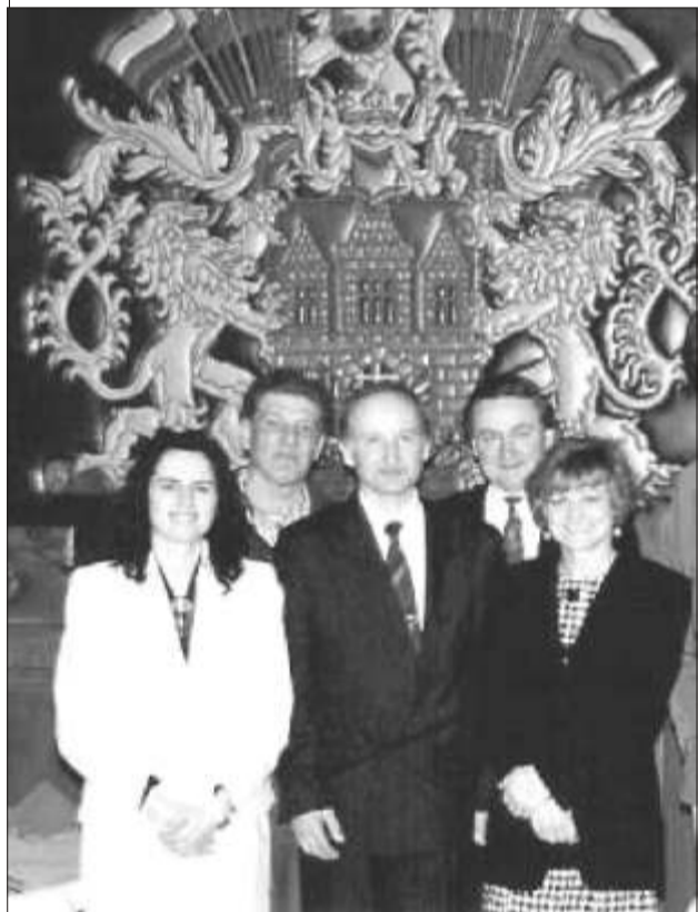
Chicago - restaurace OLD PRAG